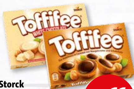
Storck Toffifee Classic oder White 15 Stück 125-g-Packung je (1 kg = 8.88 €)