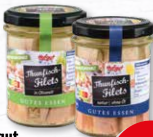
Hofgut Thunfisch-Filets natur oder in Öl verschiedene Sorten 200/190-g-Glas je (Abtropfgew. 140 g, 1 kg = 24.93 €)