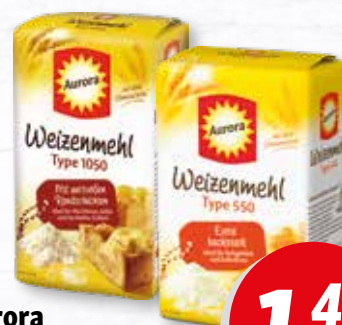
Aurora Spezialmehl verschiedene Sorten 1-kg-Packung je