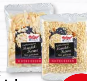
Hofgut Kalifornische Mandel-Kerne gehackt, blanchiert oder gehobelt 100-g-Beutel je (1 kg = 14.90 €)