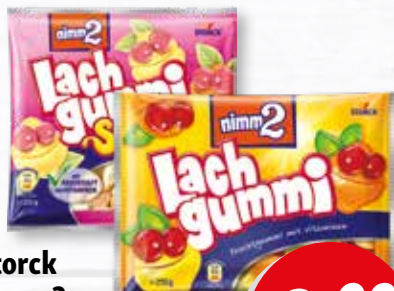
Storck nimm 2 Lachgummi verschiedene Sorten 200-325-g-Beutel je (1 kg = 3.05-4.95 €)