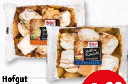
Hofgut Stollen-Konfekt Marzipan 350 g, Bratapfel oder Butter 300 g Packung je (1 kg = 11.40/13.30 €)