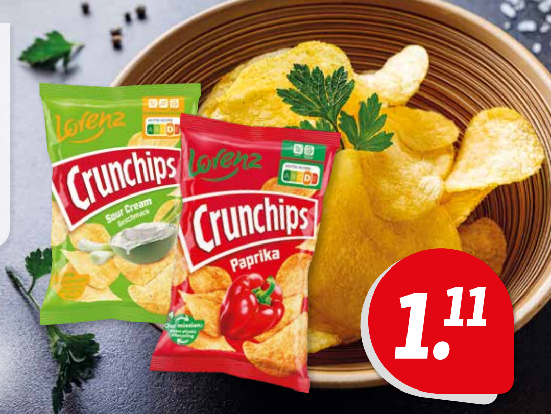
Lorenz Crunchips verschiedene Sorten 150/130-g-Beutel je (1 kg = 7.40/8.54 €)