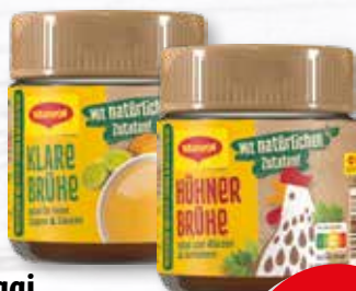
Maggi Klare Brühe oder Bouillon verschiedene Sorten für 4-7 Liter, Glas je (1 Liter = 0.21-0.37 €)