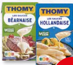
Thomy Les Sauces verschiedene Sorten 250-ml-Packung je (1 Liter = 4.76 €)