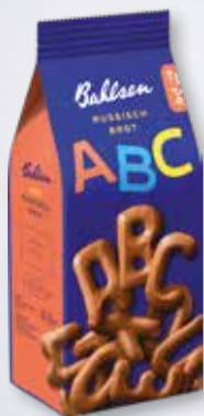
Bahlsen ABC 100-g-Beutel (1 kg = 11.90 €)