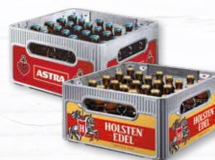
Holsten Edel, Export oder Astra verschiedene Sorten 27 Flaschen à 0,33 Liter Kiste je (1 Liter = 1,12 €) zzgl. 3.66 € Pfand