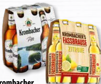
Krombacher Bier oder Fassbrause verschiedene Sorten teilweise koffeinhaltig 6 Flaschen à 0,33 Liter Packung je (1 Liter = 2,02 €) zzgl. 0.48 € Pfand