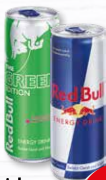
Red Bull Energy Drink verschiedene Sorten koffeinhaltig 0,25-Liter-Dose je (1 Liter = 3,96 €) zzgl. 0.25 € Pfand