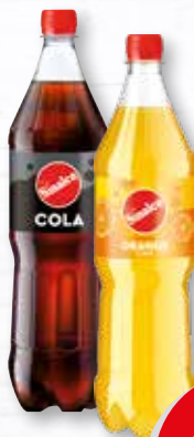
Sinalco Cola oder Limonade verschiedene Sorten teilweise koffeinhaltig 1,25-Liter-PET-Flasche je (1 Liter = 0,63 €) zzgl. 0.25 € Pfand