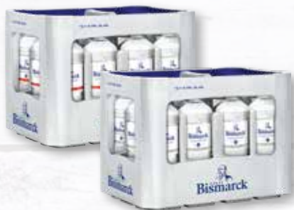
Fürst Bismarck Mineralwasser verschiedene Sorten 12 Glasflaschen à 0,75 Liter Kiste je (1 Liter = 0,44 €) zzgl. 3.30 € Pfand