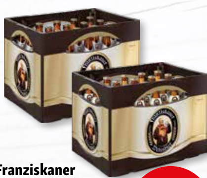
Franziskaner Hefeweissbier verschiedene Sorten 20 Flaschen à 0,5 Liter Kiste je (1 Liter = 1,60 €) zzgl. 3.10 € Pfand