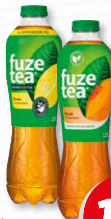
Fuze Tea verschiedene Sorten 1,25-Liter-PET-Flasche je (1 Liter = 1,11 €) zzgl. 0.25 € Pfand