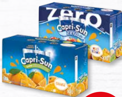
Capri-Sun verschiedene Sorten 10 x 0,2-Liter-Packung je (1 Liter = 1,40 €)