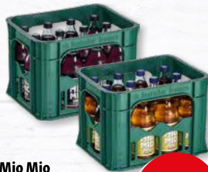
Mio Mio verschiedene Sorten teilweise koffeinhaltig 12 Glasflaschen à 0,5 Liter Kiste je (1 Liter = 1,33 €) zzgl. 3.30 € Pfand